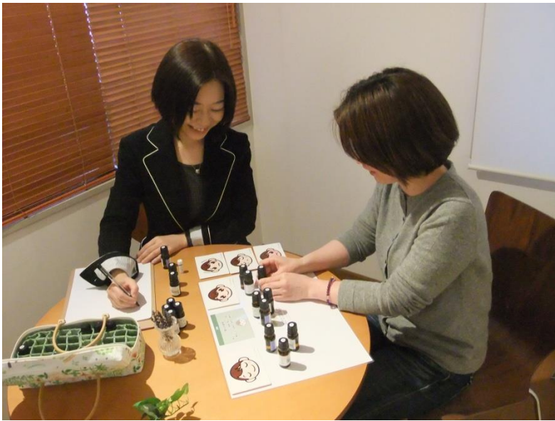
アロマップ®カウンセリングの様子