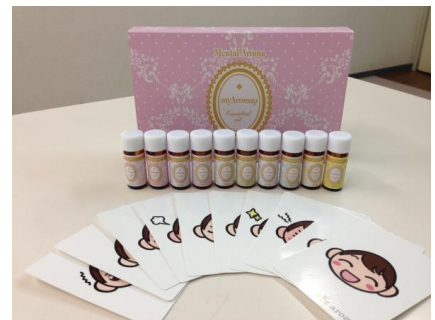
メンタルアロマのセルフキット